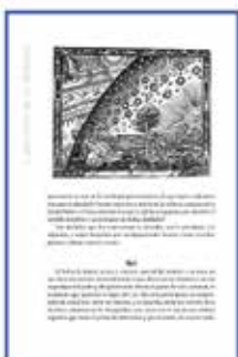
Diseño de interior