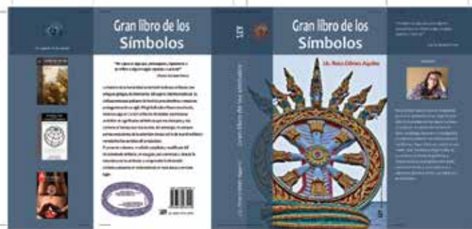
Diseño de portada